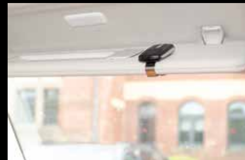
High-Line Car Kit Adapter Set Sonnenblendenclip