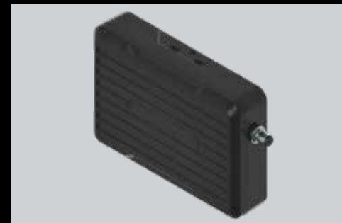
High-Line Empfänger 3-Kanal 433-868 Mhz