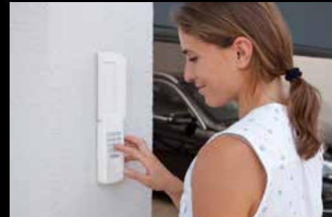
High-Line Codeschalter 3-Kanal IP54