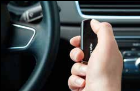
High-Line Handsender 4-Kanal 868 Mhz

Hohe Qualität, bewährte Technik und zuverlässiger Betrieb, kombiniert mit einem entsprechenden Wartungsvertrag, garantieren eine lange Lebensdauer Ihres Tores.