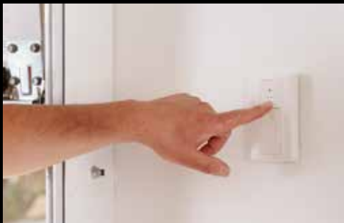
High-Line drahtloser Funk-Innentaster 2-Kanal 868 Mhz