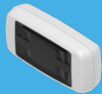
High-Line myQ internet interface 'Gateway'